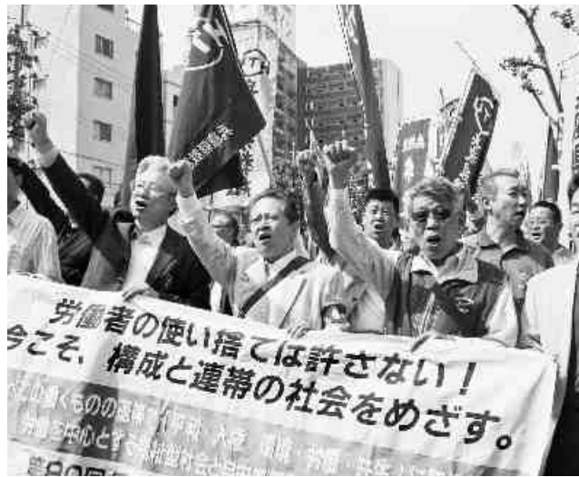
シブレビコールを力強く叫んでデモ行進。(昨年の中央メーデー、神戸市にて)

5月1日(土)第81回兵庫県メーデー神戸中央大会が、神戸大倉山公園野球場で11時より開催される。働くものの連帯で「平和・人権・環境・労働・共生」とりくみ、労働を中心とする福祉型社会と自由で平和な世界をつくらう! がメインスローガン。連合中央のとりくみに基づき、第81回メーデーでは、①社会の底割れに歯止めをかける、雇用の確保・創出・政策制度の実現②非正規雇用労働者、中小零細企業で働く労働者の処遇改善を進める③地域に根ざし顔の見える運動を訴えるをメーデーの基本的な考え方として臨む。