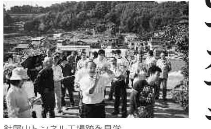
針尾山トンネル工場跡を見学。

NPPO法人長崎人権研究所の協力を得て、大村コース(殉教と戦争遺構を訪ねて)、「長崎Aコース(長崎の部落史をあるく)」、「長崎Bコース(原爆と部落とキラシタン)」の3つのフィールドワークで学習を深めた。「長崎くんち」と日が重なっていたこともあり、ちがった側面からの長崎の歴史を見ることができた。また、夕食交流会や3日目の自由行動の時間等