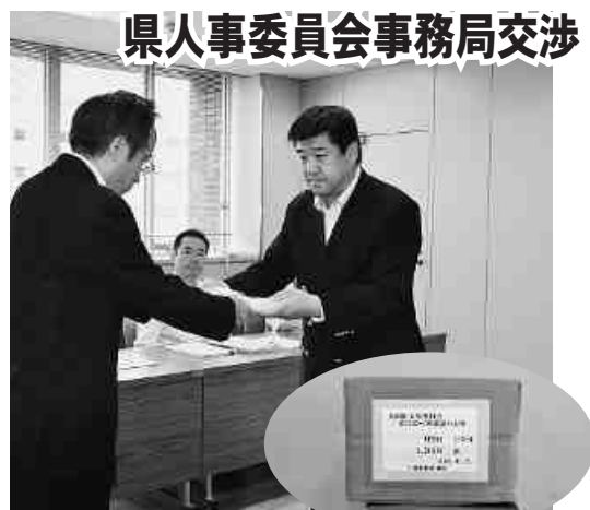
県人事委員会事務局交渉

一時金で補わざるを得ない状況にあることもわかった。地方公務員も含めた公務員を取り巻く給与情勢は厳しいパッシングが続いているが、本来受け取るべき給与がカットされ続けているという現実に対して、我々は団結を深めて、慢心の怒りをもって県当局と交渉に当たりたい。少しでも生活が改善できたと実感できる給与交渉をおこないたい。ともに頑張りましょう！と、闘う決意を述べた。