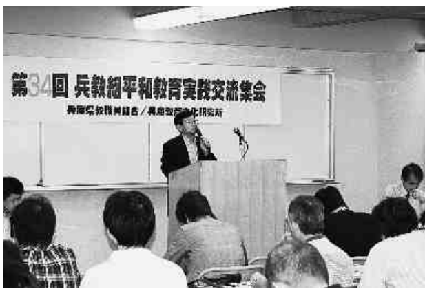
第34回 兵教組平和教育実践交流集会 兵庫県教育委員会/兵庫県立西宮高等学校