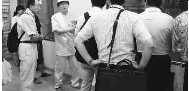
食肉センターでの説明を熱心に聞く参加者たち (8月3日、加古川にて)