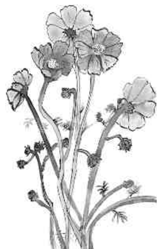
(つごもの詩と絵 第32集より)