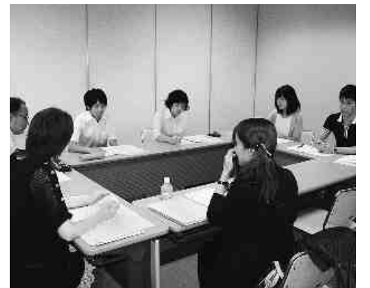
兵教組臨探部夏季学習会 分散会より (8月28日、ラッセホールで)