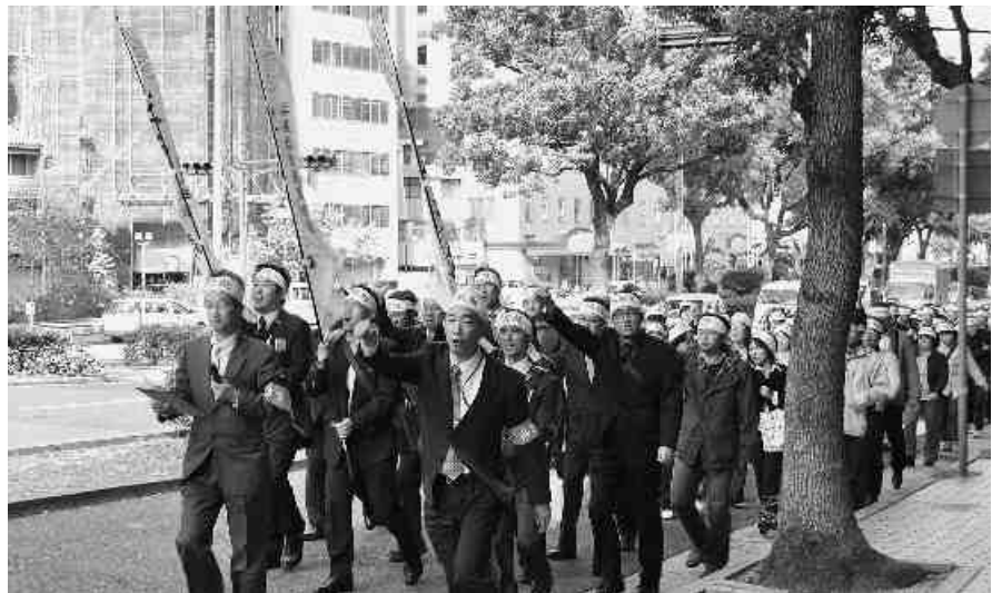
「給与削減措置を即時に回復せよ！」とシュプレヒコールをあげ県庁舎前をデモ行進する参加者たち (11月1日、県庁舎前にて)