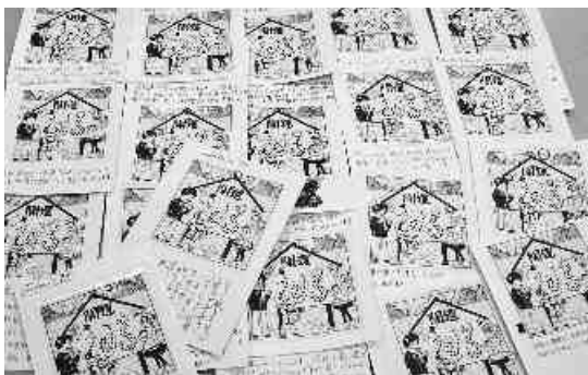
当選された方々のはがき。ご応募いただいたのはがきは、本部執行委員により厳正に抽選しました。

教育予算拡充、少人数学級・定数改善計画の実現へむけたとりくみを保護者・地域・働く仲間との社会的対話をすすめよう! 地方公務員給与削減「強制」に対し、日教組・公務労協に結集しよう!