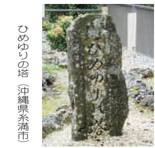
ひめゆりの塔 (沖縄県糸満市)

どこまでも果てしなく続くフエンス。我々の横を煽りながら走る米軍兵を乗せた大きなトラック。歩き始めてすぐ、言いようのない恐怖を感じた。こんな恐怖を日常的に沖縄県民に強い