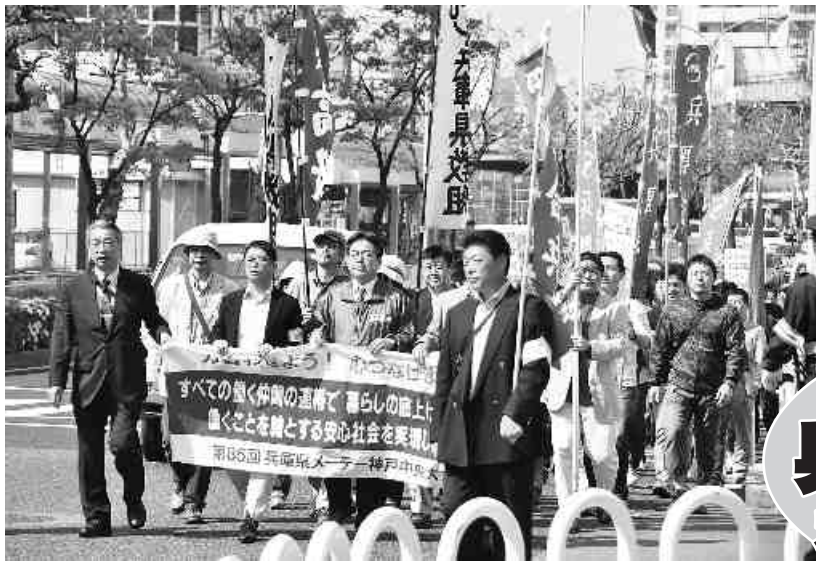
大倉山公園をめざしてデモ行進する参加者