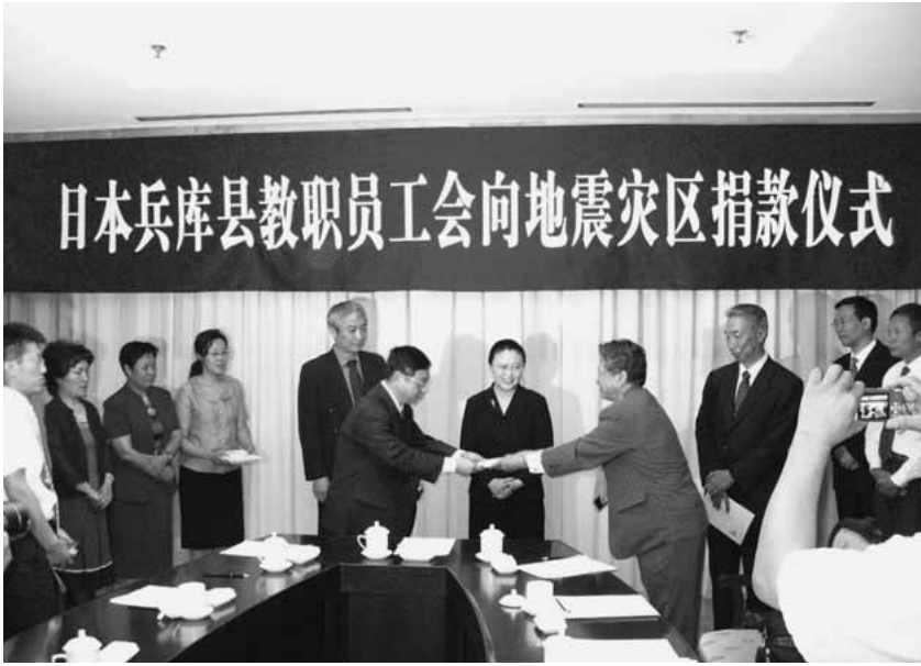
日本兵庫縣教職員工會向地震災區捐款儀式