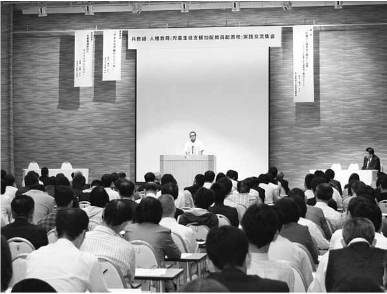
メモをとり、実践報告を聞き入る参加者たち。(5月16日、ラッセホールで)

「差別の現実に学ぶ」を基本に、兵庫の同和教育の歴史と成果をふまえ、部差別の解消をめざすと取り組むをすすめてきた。また、県教委でも策定した「人権教育基本方針」を受け、人権教育課題研究校を設置するなど、同和教育をはじめとする人権教育を積極的に推進してきた。 2002年3月、「地域改善対策特定事業に係る国の財政上の特別措置に関する法律」の失効にともない、これまで配置されてきた「同和加配」が廃止。そして、新たな加配が、児童生徒の人権課題(基本学力・進路保障、基本的な生活の確立、「生きる力」等)のある学校を中心に配置されている。