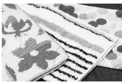
2014年版の母女ハンカチ

当初、あい色で染め抜いた「母親手ぬぐい」を作成し、「世界中のお母さん手をつなぎましょう」と運動を広げたことから「母女ハンカチ」が始まり、活動を支えるために続けられている。ハンカチはカンパという役割をはじめ、ハンカチを通して会話が生まれ、運動のことを考えるきっかけをつくっている。人から人へと思いをつなぐ「母女のハンカチ」の歴史は、母と女性教職員の運動の歴史でもある。