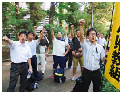
人事院前での交渉支援行動

ついては、対策を充実・強化していく。③非常勤職員の休暇について、夏季休暇の措置を講じていきたい、などと回答した。 また、給与局長は、①勧告は例年とおむね同様の日程②官民較差・一時金は現在集計中であるが、民間の状況について各種調査結果を見ると金額ベースでは、昨年冬が対前年比で増加し、本年夏が減少となっているが、月数ベースでは、冬夏ともに対前年比で増減両方の結果がある③諸手当については、民間の状況、公務の実態等をふまえ、必要となる検討をおこなっていく、などの回答を示すとどまった。 加えて、定年の引上げの実現にむけて各施策の必要性等の理解の促進に努め、必要な法律改正が早急におこなわれるよう、責任を果たしたい。新規採用者を一定数確保しながらフルタイム中心の再任用が実現できるよう、必要と取り組みをおこなっていくなどと回答した。