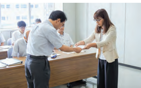
青木県職労中央執行委員長より要求書を手交

本年度、人事委員会の勧告・報告の基礎資料となる職種別民間給与実態調査については、4月26日から6月13日まで例年と同様の日程で、公務を除く全産業の事業所を対象に抽出調査をおこなった。 現在、人事院において、各人事委員会が提出した調査データのとりまとめがおこなわれている。今後、本委員会においても、調査データの提供を受けた後に、調査結果の分析等をおこなっていく。