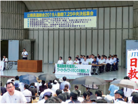
公務員連絡会は、25日、全国から3,000人の仲間を結集し、人勤期中央行動を実施した。兵教組からは25名の組合員が参加した。